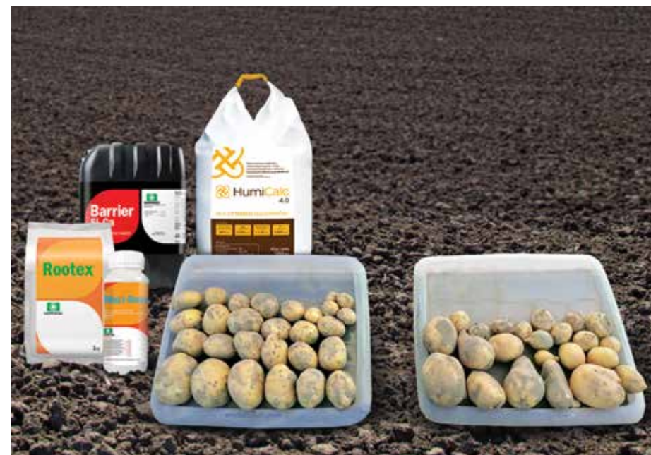
EFEKT CAŁOŚCIOWEJ TECHNOLOGII ODBUDOWY STRUKTURY GLEBY + ZAPRAWIANIE + STYMULACJA DOLISTNA